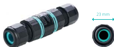
TH387 - ZŁĄCZE PROSTE MINI