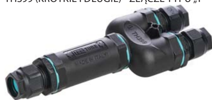
TH399 (KRÓTKIE I DŁUGIE) - ZŁĄCZE TYPU „Y”