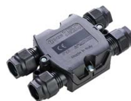
TH209 - OBUDOWA CZTERODROŻNA