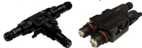
TH631, TH623 - ROZDZIELACZ PRĄDOWY