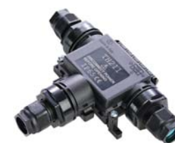
TH211 - OBUDOWA TRÓJDROŻNA

* wymagane uszczelnienie przewodów - patrz: akcesoria