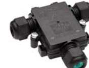
TH200 - OBUDOWA TRÓJDROŻNA MINI