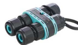
TH392 - ZŁĄCZE MINI CZTERODROŻNE