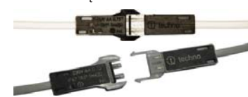
TH420 - ZŁĄCZE PŁASKIE 4 mm Z PRZEWODEM