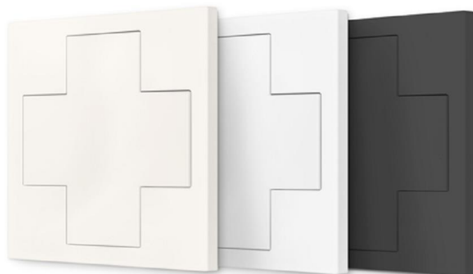
Dostępne kolory (od lewej): RAL9010, RAL9016, czarny

Moduł przycisków działający w standardzie DALI-2 z czterema niezależnymi i dowolnie konfigurowalnymi przyciskami w kształcie krzyża. Z przycisków dostępne są standardowe funkcje jak ON/OFF, ściemnianie, przełączenie, wywołanie sceny itd., oraz wspierane są także predefiniowane makra dla sterowania temperaturą barwową źródeł światła, dynamicznymi scenami świetlnymi, sekwencjami oraz listami poleceń zdefiniowanych przez użytkownika. Oprócz standardowych kolorów (kremowy, biały i czarny), dostępne są także moduły przyciskowe z gotowymi nadrukami graficznymi (tzw. layouts), na przykład ikony 'Światło & Żaluzja' (szczegóły niżej). Istnieje możliwość zamówienia indywidualnych projektów nadruków (layouts), np. symboli lub kolorowe zdjęcia pomieszczenia nadrukowane na całym module. Za pomocą darmowego oprogramowania DALI Cockpit na komputer PC (wymagany opcjonalny interfejs USB-DALI) albo aplikacji na smartfon Lunatone NFC App (wymagany smartfon z NFC), można każdemu przyciskowi przypisać niezależną funkcję lub komendę DALI.