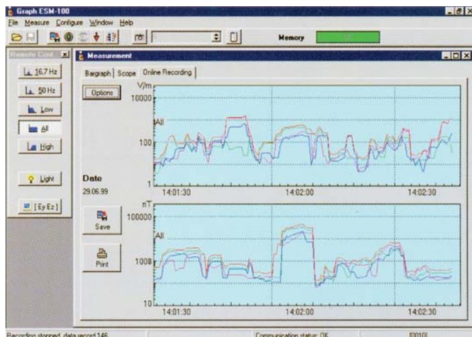
Rejestracja tendencji zmian E/H w czasie rzeczywistym

ESM-100, miernik pola E/H to opatentowany, jedyny w swoim rodzaju miernik ręczny, którym można bezproblemowo jednocześnie mierzyć zmienne pola elektryczne i magnetyczne, niezależnie od kierunku. Pozwala stworzyć własną siatkę pomiarową o zdeklarowanej wcześniej wielkości (Kolumna x Rzęd) i wypełnić ją wartościami zmierzonymi w konkretnych punktach. Zakres pomiarowy to 5Hz..400kHz i ograniczany jest przez wbudowane filtry. W przyrządzie dostępne są następujące filtry zawężające przedział mierzonych częstotliwości: 5Hz..400kHz (All), 2kHz..400kHz (High), 5Hz..2kHz (Low), 50Hz pasmowoprzepustowy (50), 16,7Hz pasmowoprzepustowy (16). Dużą zaletą pakietu ESM-100 jest specjalnie do niego napisane oprogramowanie Graph ESM-100 pracujące poprawnie na komputerze klasy PC, wyposażonym w Windows NT/95 lub nowszy. Komunikacja przyrządu z komputerem odbywa się przez interface RS 232.