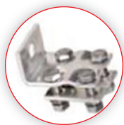
Wzmocniona stal do połączenia przewodów aluminiowych

U_N = 3,6 \text{ kV} \dots 24 \text{ kV}