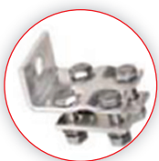
Wzmocniona stal do połączenia przewodów aluminiowych

U_N = 3,6 \text{ kV} \dots 24 \text{ kV}