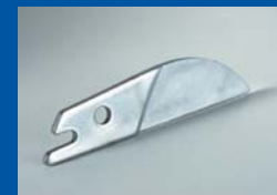
Dodatkowe ostrze dla narzędzia 4F.

Specjalnie zaprojektowany uchwyt i akcesoria pozwalają na dokładne cięcie przy minimalnym wysiłku.