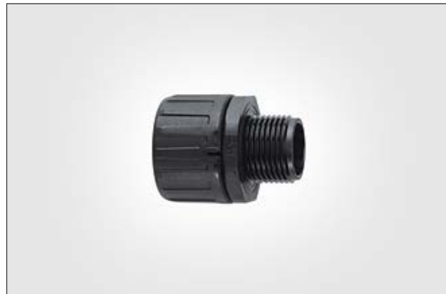
Złącze końcowe proste HelaGuard HG-S, IP66.

Osprzęt końcowy wyposażony w gwinty UNEF i NPT jest dostępny na zamówienie. Skontaktuj się z nami!