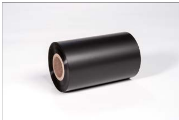
Taśmy barwiące do etykiet samoprzylepnych.