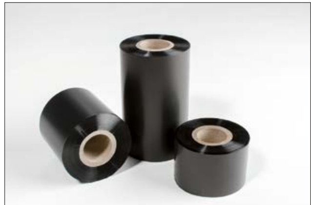
Taśmy barwiące do termokurczy i szyldów oznaczkowych.