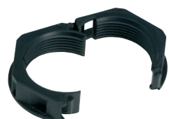
Typ GMT: Nakrętka dzielona