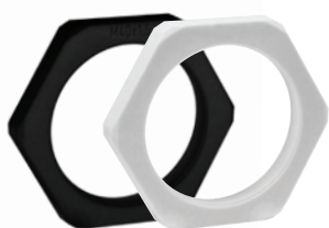
Typ KGM: Nakrętka plastikowa