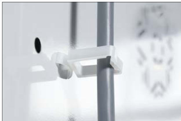
WPC – Wire Push In Clip.