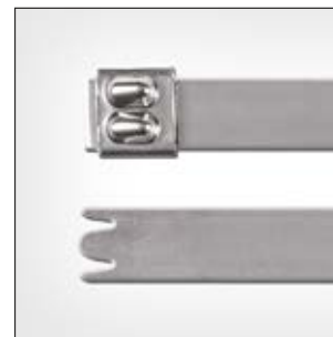
Opaski stalowe, niepowlekane, MBT_XHS.

i Możliwość wspierania procesów zapewnienia jakości obowiązujących w produkcji artykułów spożywczych, np. HACCP