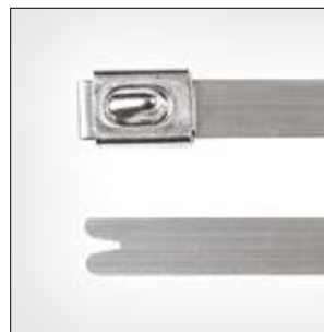
Opaski stalowe, niepowlekane, MBT_SS, MBT_HS.