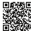
Film instruktażowy: REZ

Minimalna ilość zamówienia (MOQ) może się różnić w zależności od zawartości opakowania. Dostępne mogą być również inne opcje opakowania.