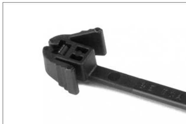
Opaska kablowa serii REZ z ergonomicznym mechanizmem rozpinania.