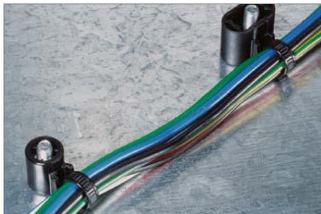
Zewnętrznie zabkowane opaski mocujące prowadzą wiązkę bezpośrednio przy bolcach mocujących.