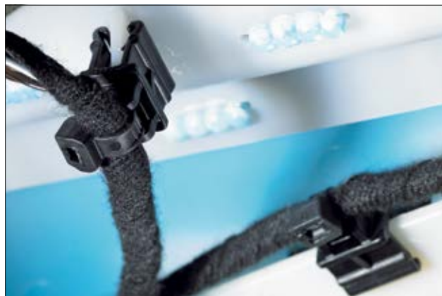
T50ROSEC10 założony na krawędź z tworzywa sztucznego.