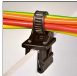
Jednoczęściowa opaska mocująca T50SOSEC12 może być łatwo zamontowana na krawędź.

Srebrnoszary zacisk, serce naszych uchwytów EdgeClip, wykonany jest z podwójnie hartowanej stali sprężynowej, zgodnej z normą EN 10132-4 C75S. Stal ta zapewnia zaciskowi zarówno potrzebną sztywność gwarantującą dużą wytrzymałość na siły odrywające, jak też wystarczającą elastyczność do różnych możliwych zastosowań