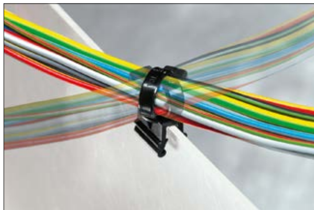
EdgeClip CBTO50R można obracać o 90°.