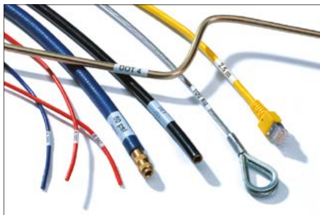
Proste oznaczenie zarówno giętkich jak i sztywnych przewodów.