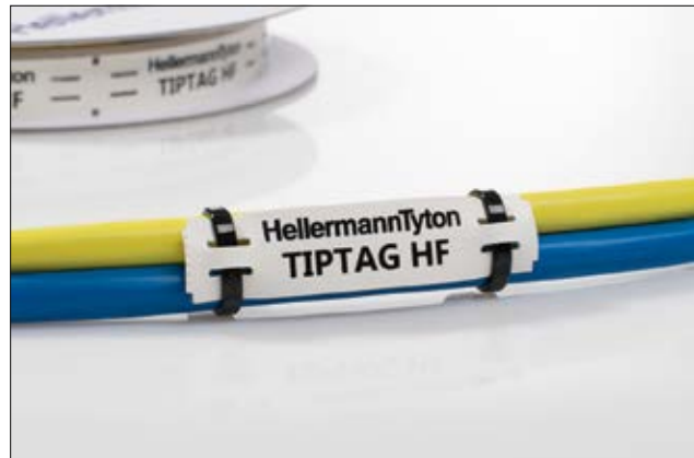
TIPTAG - Profesjonalne oznaczenie wiązek kablowych.