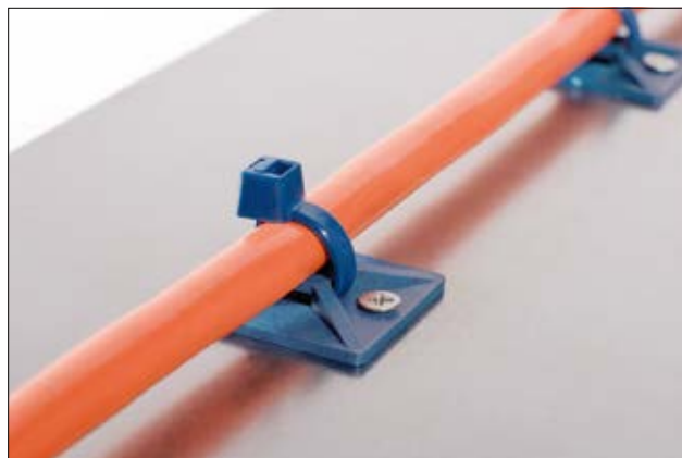
Wykrywalne rozwiązanie mocowania składa się z cokołu MCMB oraz opaski MCT.