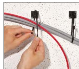
Tylko opaski Q można stosować bez dodatkowego wysiłku zarówno do czasowego, jak i stałego wiązania przewodów.