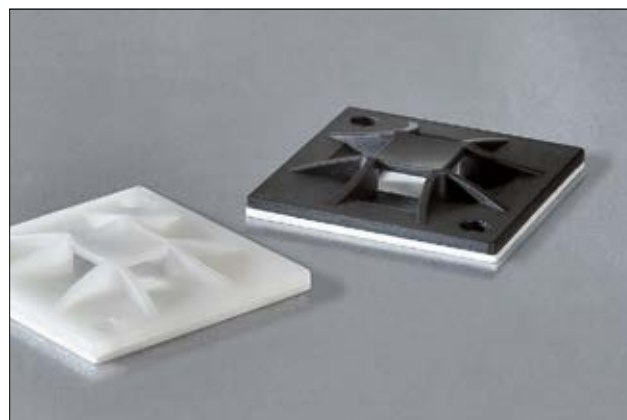
Elementy mocujące QM, 4 wejścia, samoprzylepne/przykręcane.