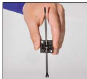
Cokół Q-mount blokuje opaskę Q-tie w pozycji pionowej. Twoje ręce są wolne przy mocowaniu przewodów.