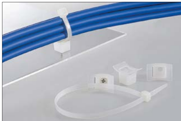
Cokół mocujący serii LKC.