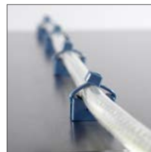
Wykrywalne rozwiązanie mocowania składa się z cokołu MCKR oraz opaski MCTS.