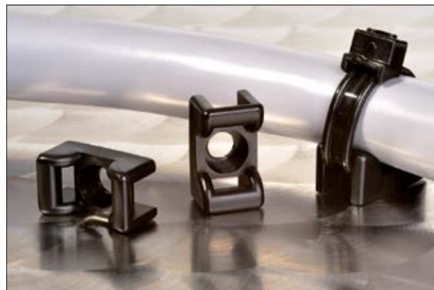
Element mocujący KR6G5, KR8G5 i CTM.