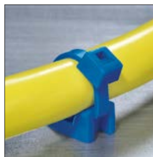
Element mocujący KR6G5-E/TFE.