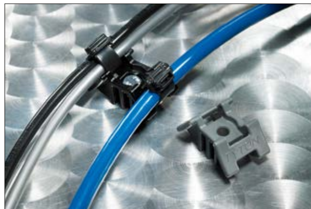
Uchwyt dystansowy jest przeznaczony do mocowania 2 wiązek, które powinny zachować określony odstęp pomiędzy sobą.