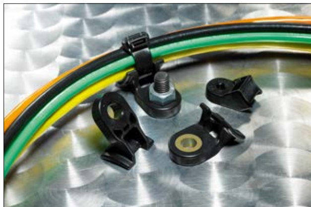
Elementy mocujące do dużych obciążeń serii HDM, Patent nr US5820083.