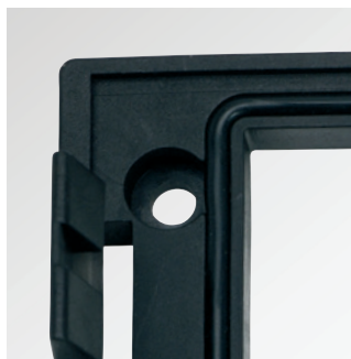
Zintegrowane uszczelnienie (IP54)