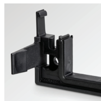
Zintegrowane uszczelnienie (IP54)