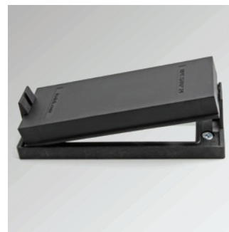
Zaślepki BPK-SNAP, patrz strona 282