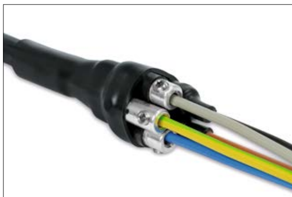
LVK-C - mufa termokurczliwa do połączeń kablowych.