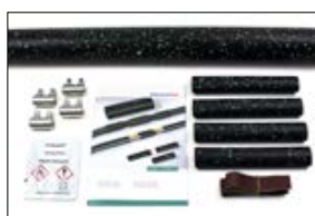
LVK-C: rurka zewnętrzna, rurki wewnętrzne, złączki śrubowe, ściereczka nasączona odtłuszczaczem, papier ścierny, instrukcja montażu.