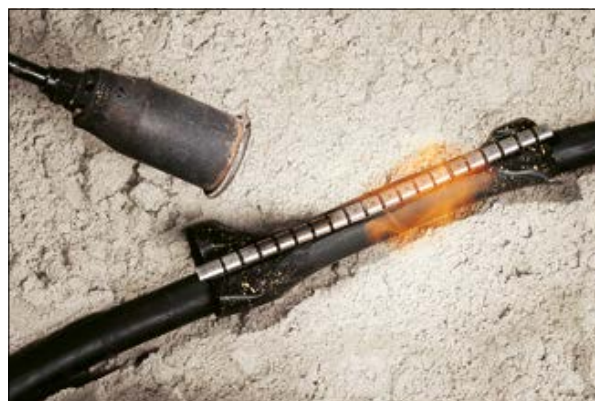
Rękaw termokurczliwy RMS to doskonałe rozwiązanie do naprawy i zabezpieczenia kabli elektrycznych w terenie.