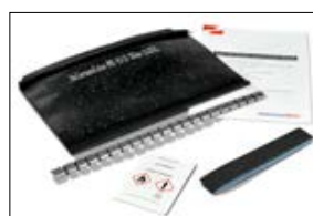
Zestaw RMS: oplot, stalowa szyna, pasek materiału ściernego, środek czyszczący, instrukcja.