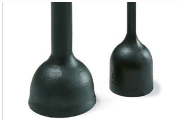
Helashrink 177-1-G przed / po obkurczeniu.