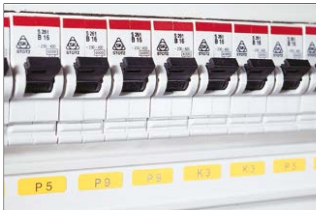
Oznaczenie aparatury łączeniowej.