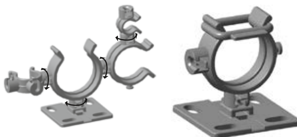
Uchwyty mocujące można ze sobą łączyć. Po połączeniu obracają się swobodnie względem siebie.