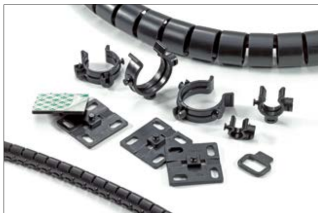
Zestaw akcesoriów Helawrap dopasowany do bezpiecznego mocowania i przejrzystego prowadzenia.