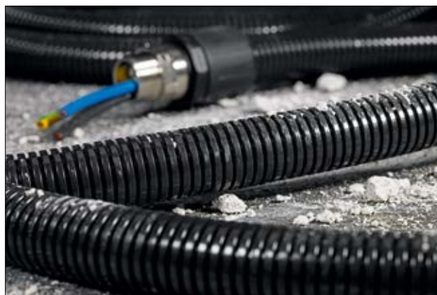
Rura HelaGuard PA6 Standard do zastosowań w przemyśle.