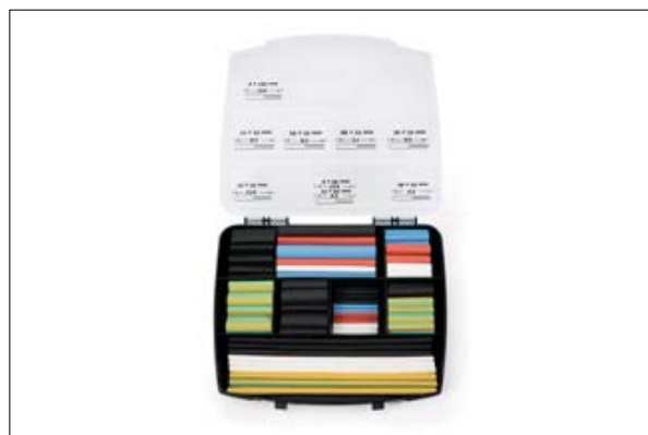
ShrinKit 321 Universal Basic - 177 elementów, stopień skurczu 3:1.