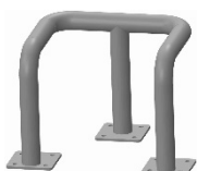
BARIERKA KOLUMNOWA „U”