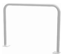
BARIERKA TYP 1