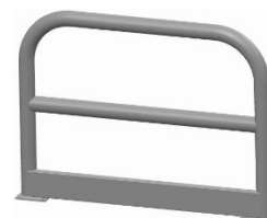
BARIERKA TYP 3