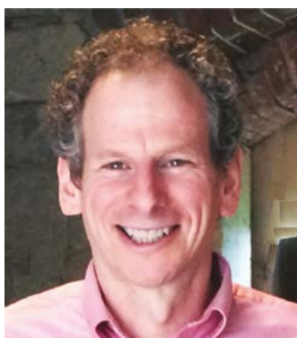
Lee Hill SILENT Solutions LLC & GmbH

Zaprosiliśmy uznanego specjalistę w dziedzinie kompatybilności elektromagnetycznej, aby mógł kompetentnie podzielić się swoją wiedzą z uczestnikami kursu.