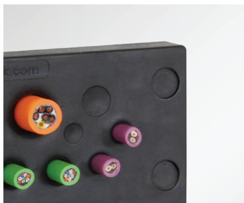
KEL-DPU dostępne również w kolorze czarnym