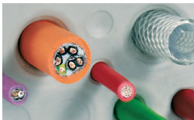
Widok z przodu przepustu