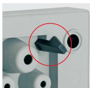
Montaż bez użycia narzędzi dzięki funkcji zatrzaskowej