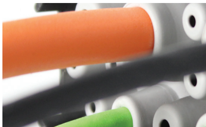
Widok z tyłu przepustu