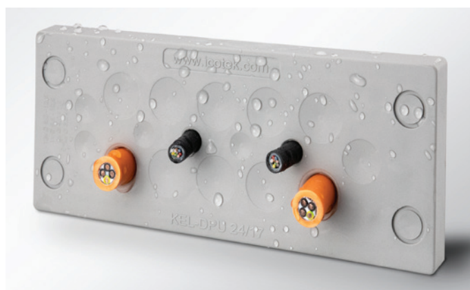
Odporny na działanie przemysłowych detergentów (certyfikat ECOLAB)