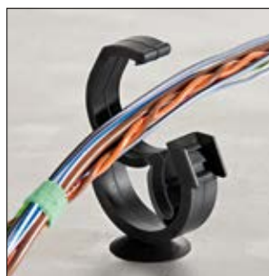
AHC (Automatic Harness Clip) otwarty.