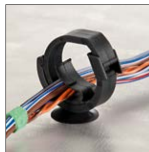
AHC (Automatic Harness Clip) zamknięty.