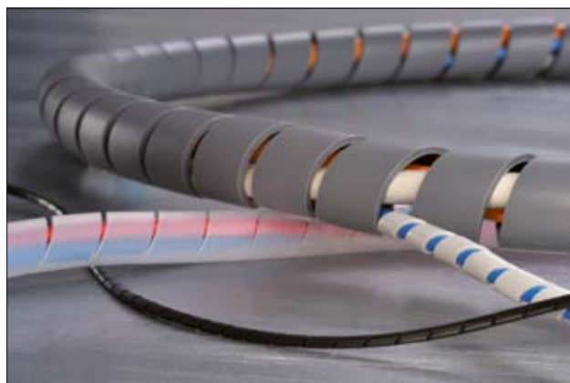
Wąż spiralny SBPE.