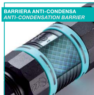
CONDENSA ALL'INTERNO DEL CAVO CONDENSATION INSIDE THE CABLE