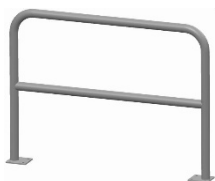
BARIERKA TYP 2